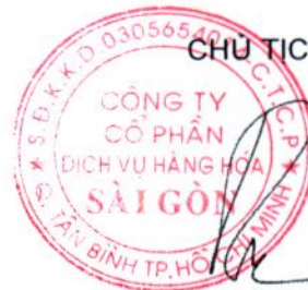
ĐỖ TẤT BÌNH